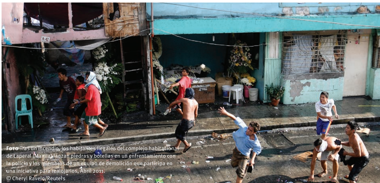
Foto Tras un incendio, los habitantes ilegales del complejo habitacional de Laperal (Manila) lanzan piedras y botellas en un enfrentamiento con la policía y los miembros de un equipo de demolición que participa en una iniciativa para realojarlos, Abril 2011.

El trabajo de investigación realizado para este capítulo sugiere que los países que registran una mejora de su IDH son más susceptibles de tener reducciones en los niveles de violencia letal. En otras palabras, existe un vínculo negativo y considerable entre las tasas de homicidio y los cambios en la clasificación según el IDH de un país (ver Figura 5.2). Ahora bien, resulta difícil determinar si los niveles de violencia redundan en un menor puntaje. Los datos por países entre 2000 y 2009 indican que a mayor disparidad de ingresos, mayores tasas de homicidios. Lo contrario es también verdad: las sociedades que registran una disparidad de ingresos considerablemente menor, también reportan niveles mucho menores de violencia homicida. Estas conclusiones coinciden y confirman el cuerpo de investigación que identifica un sólido vínculo entre la desigualdad de ingresos y los actos criminales violentos.