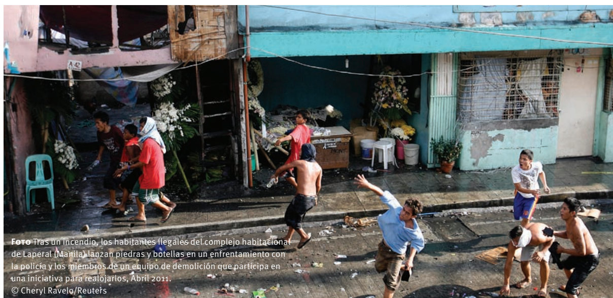
Foto Tras un incendio, los habitantes ilegales del complejo habitacional de Laperal (Manila) lanzan piedras y botellas en un enfrentamiento con la policía y los miembros de un equipo de demolición que participa en una iniciativa para realojarlos, Abril 2011.

El trabajo de investigación realizado para este capítulo sugiere que los países que registran una mejora de su IDH son más susceptibles de tener reducciones en los niveles de violencia letal. En otras palabras, existe un vínculo negativo y considerable entre las tasas de homicidio y los cambios en la clasificación según el IDH de un país (ver Figura 5.2). Ahora bien, resulta difícil determinar si los niveles de violencia redundan en un menor puntaje. Los datos por países entre 2000 y 2009 indican que a mayor disparidad de ingresos, mayores tasas de homicidios. Lo contrario es también verdad: las sociedades que registran una disparidad de ingresos considerablemente menor, también reportan niveles mucho menores de violencia homicida. Estas conclusiones coinciden y confirman el cuerpo de investigación que identifica un sólido vínculo entre la desigualdad de ingresos y los actos criminales violentos.