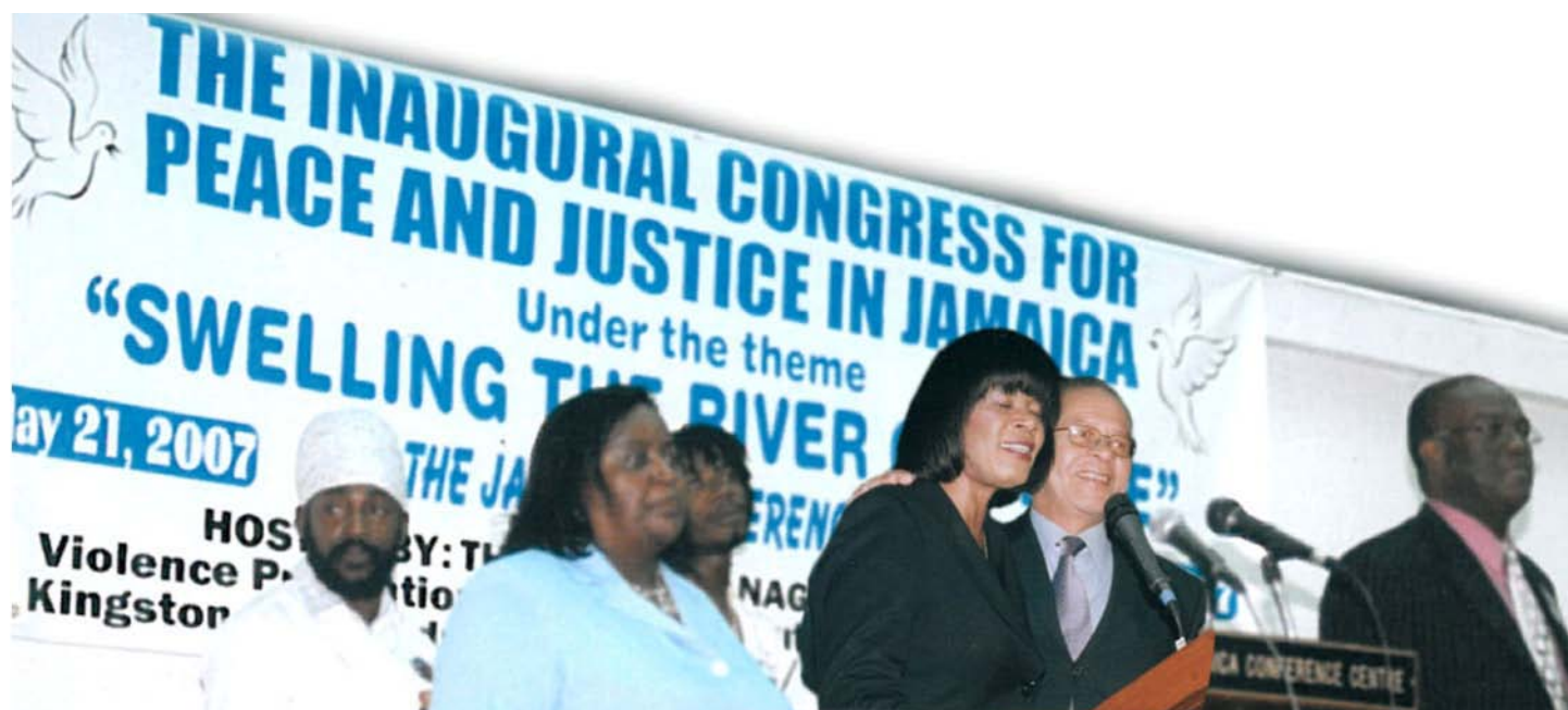
PMI involucrando la dirección política en la consolidación de la paz.

El YMCA Youth Development Programme (el Programa de la ACJ para el Desarrollo de los Jóvenes) (YDP) 5 quiere ayudar a los chicos de bajos ingresos de 14 a 17 años que no están en programas de educación, empleo o formación a adquirir aptitudes personales, calificaciones académicas y a lograr objetivos personales de desarrollo (Guerra et al, 2010, p. 8). Los chicos, todos de comunidades en el Área