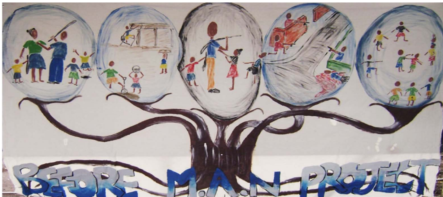
Este mural muestra la representación de los chicos de la violencia comunitaria y doméstica antes del primer programa de Male Awareness Now (Conciencia de la Masculinidad Ahora) (MAN).

CRP y CFW son explícitos en decir que no son programas de prevención de la violencia. Como el YDP de la ACJ, estos dos programas se centran en proveer la protección global. Por enseñar las