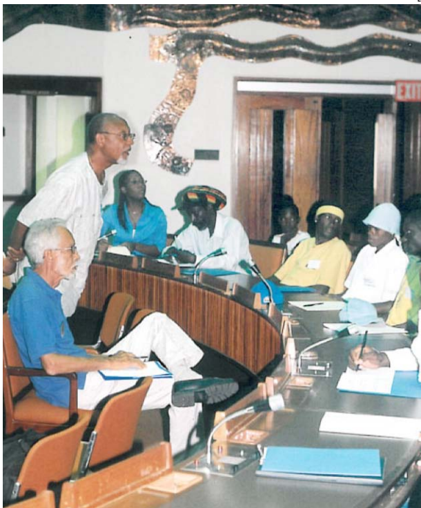
Facilitando la paz en una reunión fuera de la comunidad.

Otras asociaciones esenciales que recibieron comentarios repetidos fueron la Fundación de Arreglo de Diferencias, la Unidad de Vigilancia Comunitaria de la Policía Jamaíquina, la Comisión de Desarrollo Social, la iglesia (que asume un gran parte de los costos del CRP), y los empresarios locales.