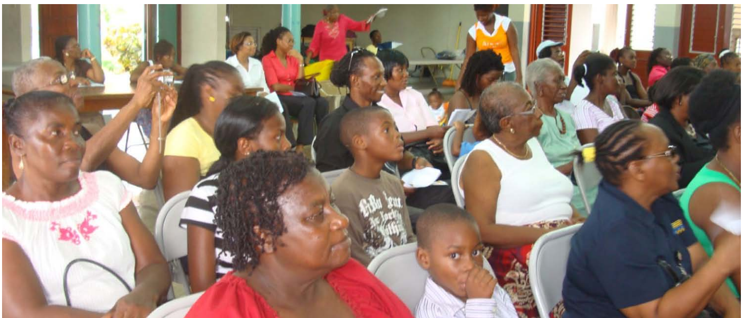
Foto del Child Resiliency Programme (el Programa para la Resistencia de los Niños) mostrando una sesión sobre la crianza eficaz de los niños.

Los líderes han creado una circunscripción para ayudarles a perseguir un plan de cambio. Un programa eficaz de