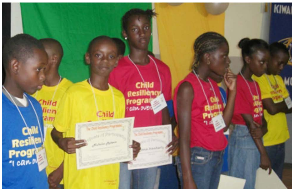
Los graduados del Child Resiliency Programme (el Programa para la Resistencia de los Niños) mostrando sus certificados

Los padres son los primeros modelos a imitar. Si ellos no entienden y modelan conductas sociales positivas, no pueden animarlas en sus niños. Todos los tres