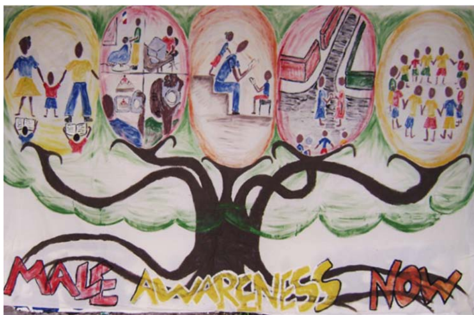
El mural de Children First, acabado después de un ciclo del programa MAN, mostrando mejoras grandes en las relaciones comunitarias y las relaciones entre padres e hijos. © Children First